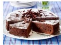
= das Zitroneneis