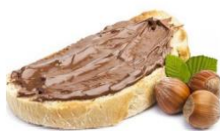
Brot mit Nutella