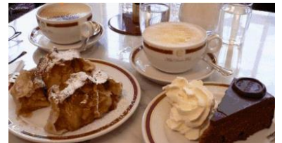
der Kaffee und Kuchen