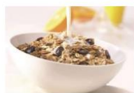
Müsli mit Milch